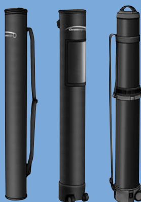
Un conditionnement adapté à vos besoins. Tubular cases adapted to your needs.