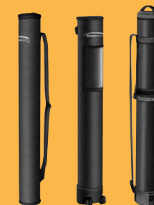
Un conditionnement adapté à vos besoins. Tubular cases adapted to your needs.